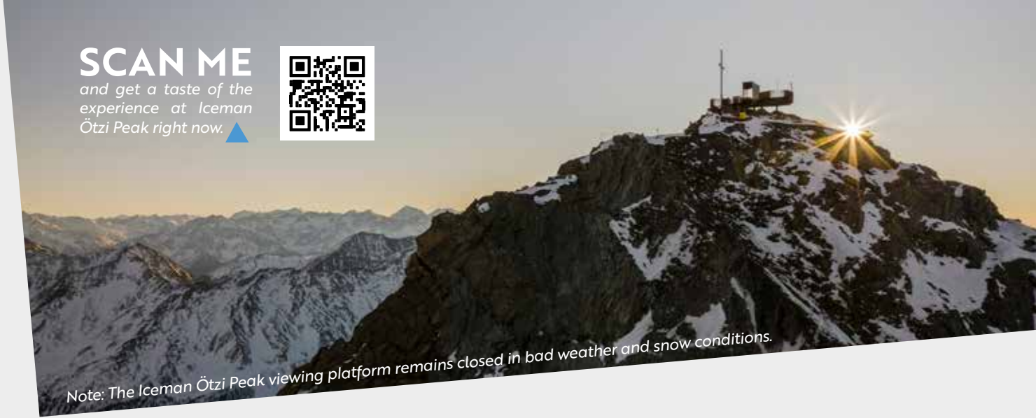
Note: The Iceman Ötzi Peak viewing platform remains closed in bad weather and snow conditions.